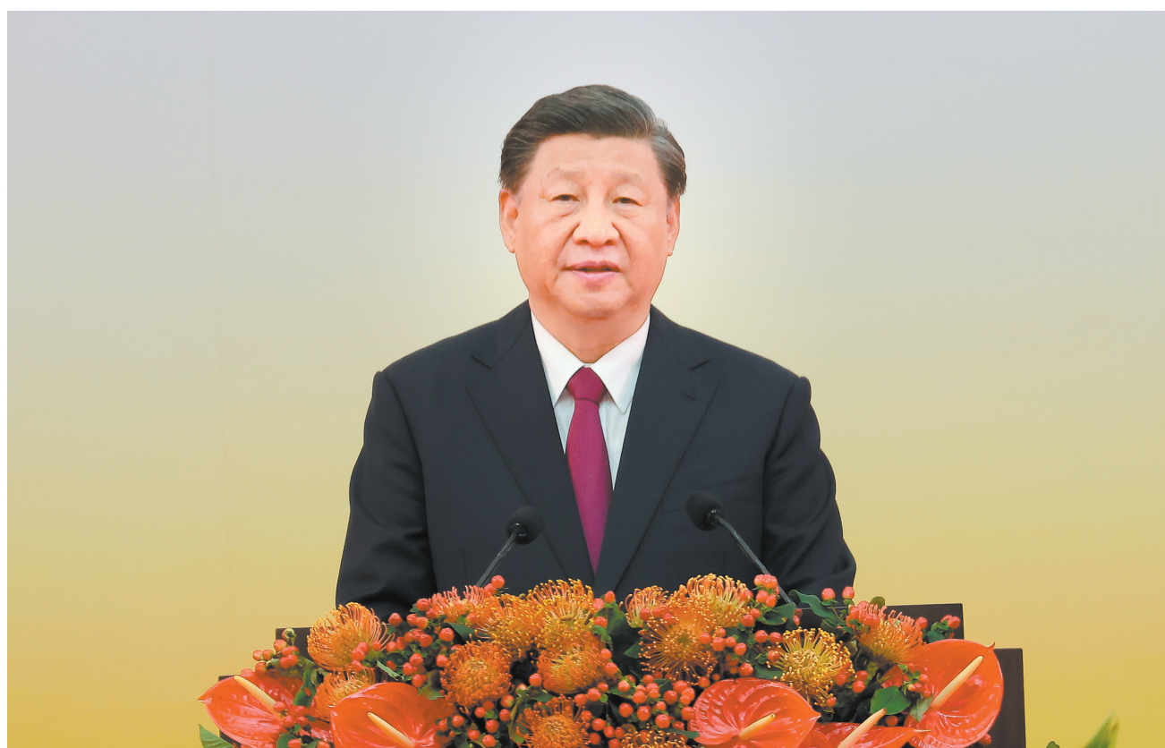
7月1日上午,庆祝香港回归祖国25周年大会暨香港特别行政区第六届政府就职典礼在香港会展中心隆重举行。中共中央总书记、国家主席、中央军委主席习近平出席并发表重要讲话。

■必须全面准确贯彻“一国两制”方针,必须坚持中央全面管治权和保障特别行政区高度自治权相统一,必须落实“爱国者治港”,必须保持香港的独特地位和优势。