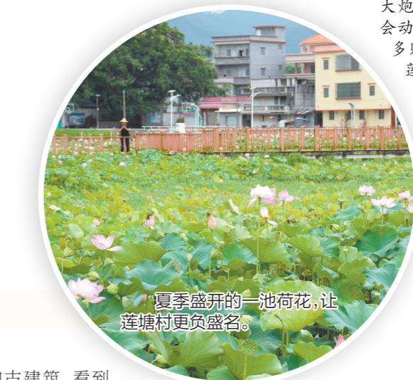
夏季盛开的一池荷花，让莲塘村更负盛名。

近年来，牛江镇通过深入挖掘本土特色文化，致力发展文旅产业，推动三产融合，取得了一定成效。2019年以来，牛江镇重点打造冯如文化精品线路，昌梅村、莲塘村成了路线中的重要一环，迎来了不少游客。