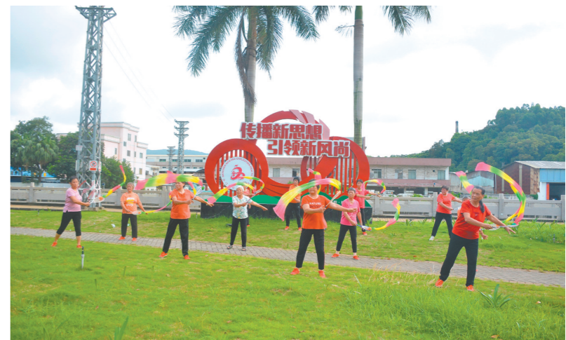
柔力球培训活动助力市民科学健身。

江门日报讯(文图 记者/罗霏 通讯员/朱晓静)为贯彻《全民健身计划(2021—2025年)》,近日,区文化馆在杜阮镇文化广场举办“舞出健康新风尚 展现幸福精气神”柔力球培训活动,促进全民健身运动广泛开展,丰富市民健身项目。