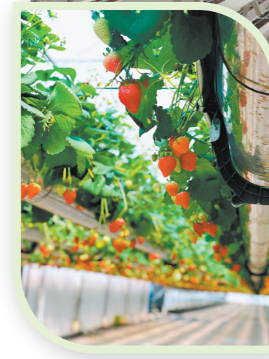
←此前,现代农业种植大棚种植过草莓等作物。