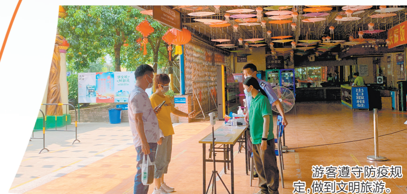
游客遵守防疫规定，做到文明旅游。

总体平稳有序。在中秋假期期间，市文化广电旅游体育局每天派出执法队伍对文旅市场进行疫情防控和安全生产巡查，维护文旅市场秩序。自9月9日起，全市文化广电旅游体育局共派出检查人员1526人次，检查场所515家次。