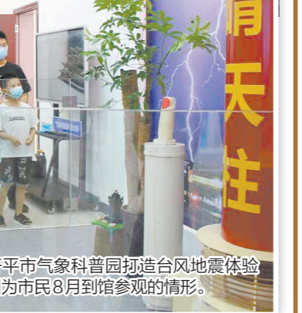
开平市气象科普园打造台风地震体验馆。图为市民8月到馆参观的情形。

经过调研与交流,省检查组认为,开平市以创建全国科普示范县为抓手,取得了全面成效,党委政府通盘布局,发挥成员单位机制作用,实现“大联动