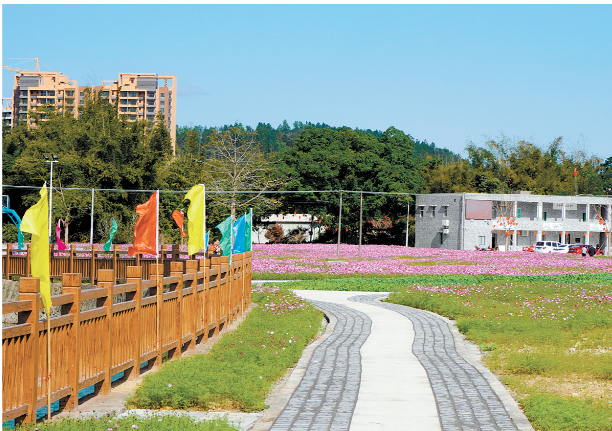
良西镇人大代表解决群众反映问题，推动乡村旧貌换新颜。