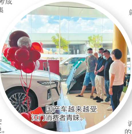
国产车越来越受江门消费者青睐。

经济的向好发展，让江门市民的“钱包”鼓起来。根据官方数据显示，我市居民人均可支配收入由“十二五”期末的2.2万元增加到“十三五”期末的3.2万多元，年均增长9.4%，2021年全年居民人均可支配收入更是达到3.7万多元，同比增长10.1%，其同比增长速度在珠三角九个城市中排名第一。毫无疑问，“钱包”鼓起来，让江门消费者买车更有热情。