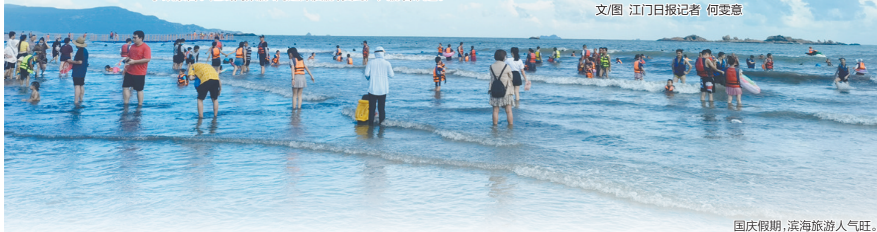
国庆假期，滨海旅游人气旺。