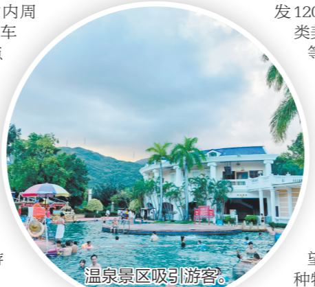
温泉景区吸引游客。

值得一提的是，乡村旅游升温也带动了民宿。新会石洞故事、望岗碉楼、玄潭原舍、碉民部落等特色精品民宿更是一房难求。