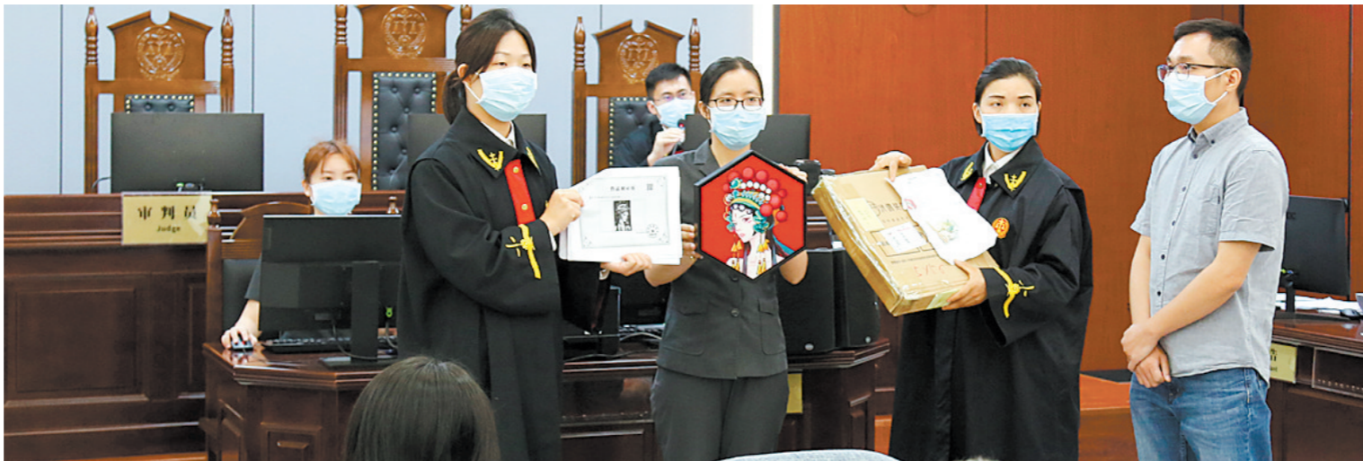
合议庭法官组织当事人对涉案作品进行比对。

未来，江海法院将继续依靠“中国侨都”独特优势，以江门巡回审判法庭为窗口，为江门乃至粤港澳大湾区企业提供高质量、高水平的知识产权司法保护，充分展示江门知识产权保护成果，优化我市区域创新环境和营商环境。