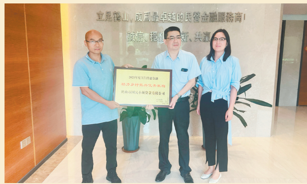
鹤山国民小贷公司助力小微企业成长及农业发展获得表彰。