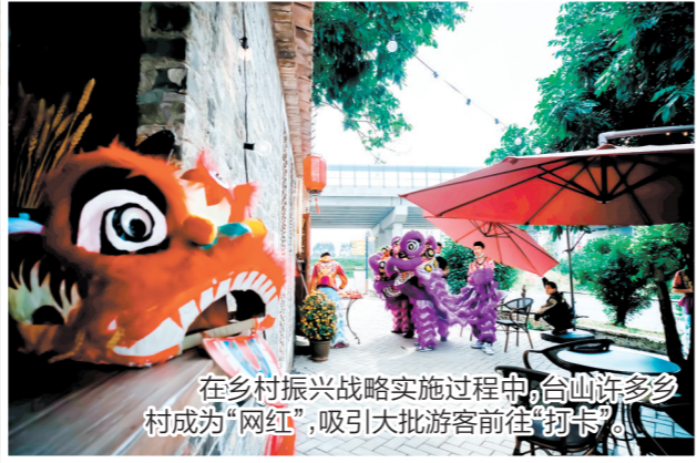
在乡村振兴战略实施过程中,台山许多乡村成为“网红”,吸引大批游客前往“打卡”。

“擂台赛”分为抓党建促乡村振兴示范镇和示范村评比两个部分。比赛现场,17个镇(街)、21条村的党组织书记聚焦“产业兴旺、生态宜居、乡风文明、治理有效、生活富裕”总要求,围绕产业、人才、文化、生态、组织五大振兴,纷纷亮出真本事、秀出真功夫,充分展示了台山全市上下抓党建促乡村振兴工作的新局面新气象。示范镇、村评比综合得分由“擂台赛”得分和日常工作得分两部分构成,各占50%,台山市委将确定4个镇(街)、13条村代表台山市参加江门市抓党建促乡村振兴示范镇、村评比。