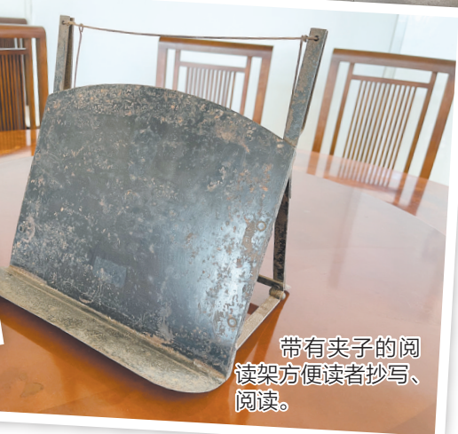
带有夹子的阅读架方便读者抄写、阅读。