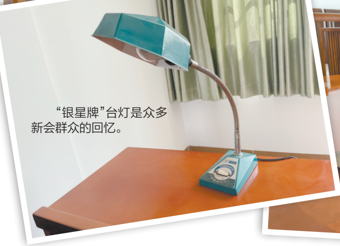
“银牌”台灯是众多新会群众的回忆。