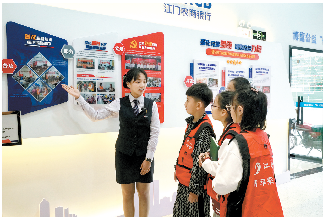
工作人员向小记者介绍江门农商银行金融服务站的情况。