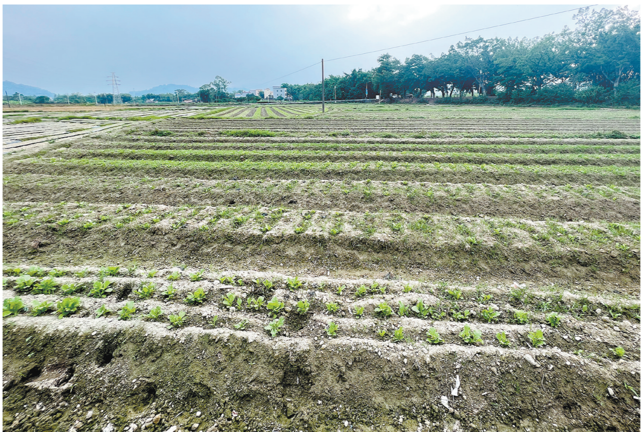
在人大代表的努力下，撂荒地变优质菜地。