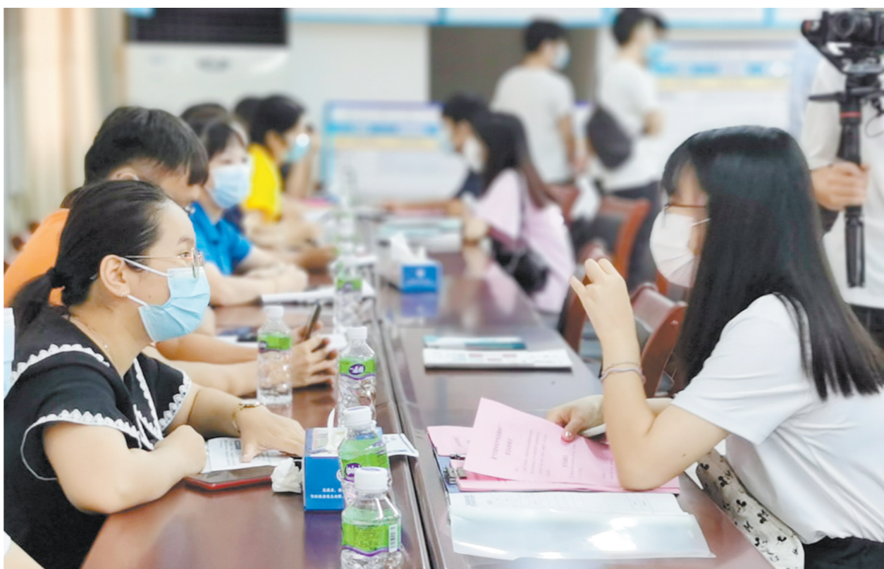
恩平市举办高校毕业生招聘会，为高校毕业生来恩平工作提供良好平台。