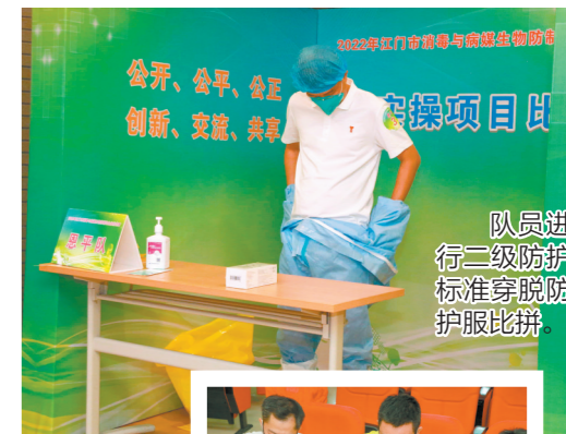
队员正在进行二级防护标准穿防护服比拼。队员正在用诱蚊灯调查蚊密度。

江门日报(文/图 记者/蔡昭璐 邓榕 通讯员/阮荣彪)11月16日,2022年全省消毒与病媒生物防制职业技能竞赛江门选拔赛在江门市疾控中心举办,来自五邑地区各县(市、区)7支队伍进行现场比拼。