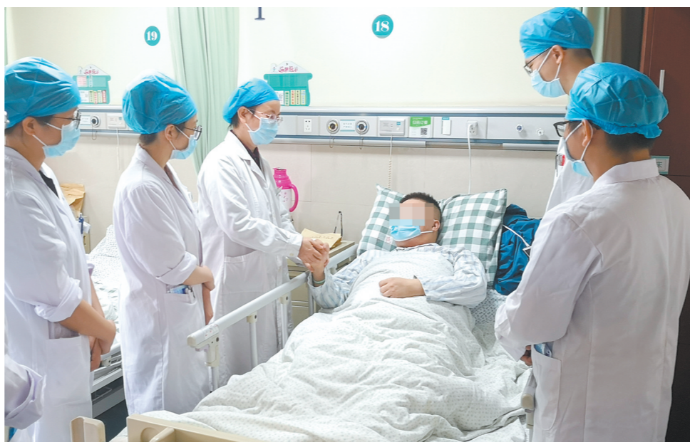
医生查看患者情况。