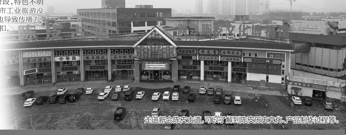
走进新会陈皮古道，可以了解到陈皮历史文化、产品制作过程等。