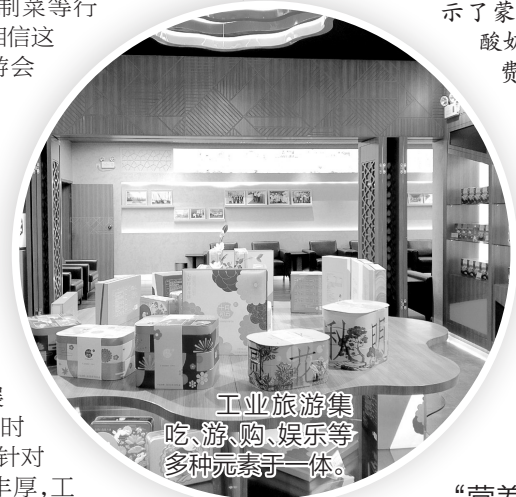
工业旅游集吃、游、购、娱乐等多种元素于一体。