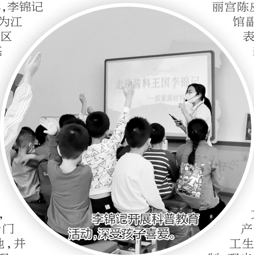
李锦记开展科普教育活动，深受孩子喜爱。

截至2022年10月，汤臣倍健透明工厂已累计接待国内外参观游客超110万人次，同时还是“国家AAAA级旅游景区”。