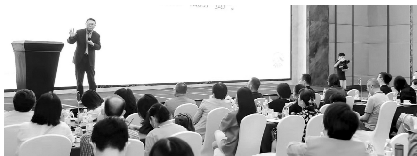
“中国新时代 财富新格局”理财论坛现场。