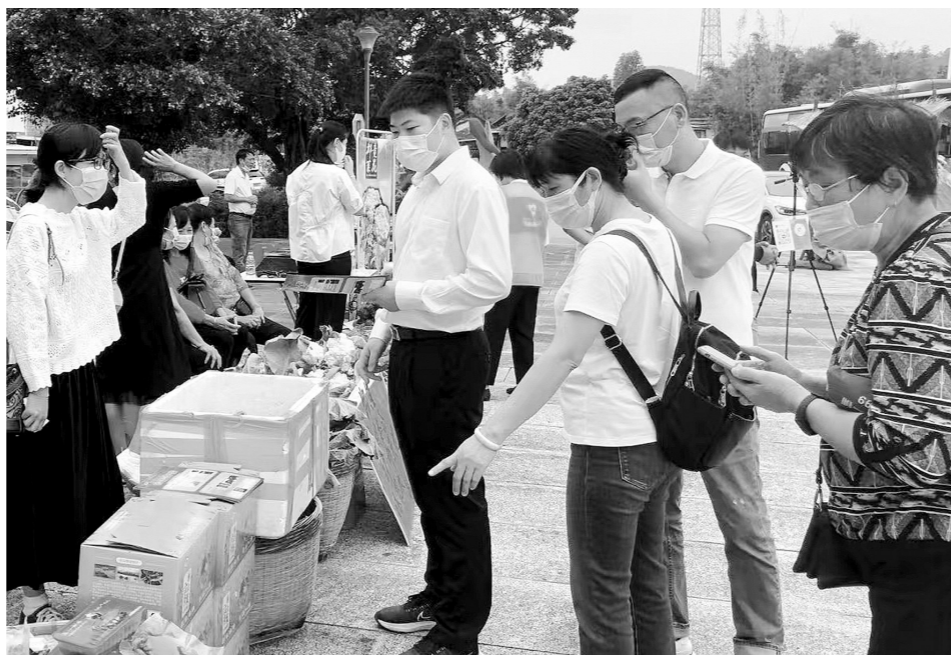
移动支付为人们在乡镇消费购物提供了很大便利。