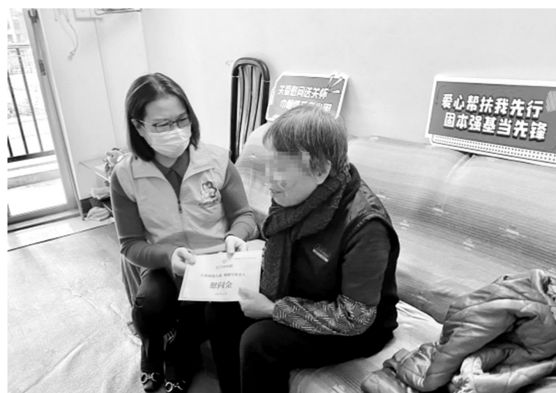
巾帼志愿者向慰问对象送上慰问金。

江门日报讯(文/图 记者/郭永乐 通讯员/黎君琼)“阿姨，我们来看您啦，您冷不冷呀?食物够不够啊?……”巾帼志愿者关怀地问候着独居老人阿姨，她的脸上露出了幸福的笑容。