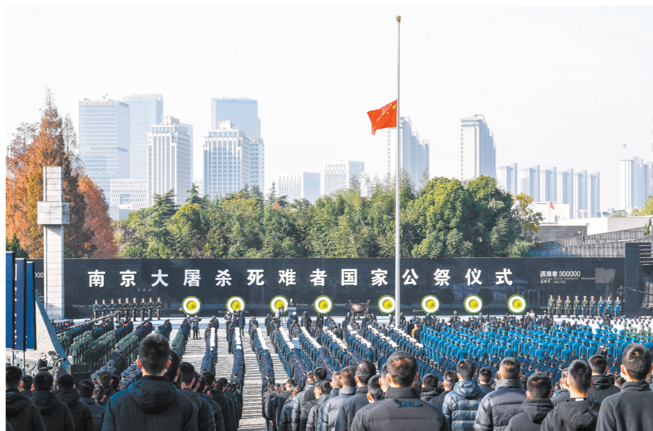
12月13日拍摄的南京大屠杀死难者国家公祭仪式现场。

“我们很快就会度过这个难关，群魔乱舞之后，安宁和秩序将会重新来临……”南京大学拉贝与国际安全区纪念馆内，学生们朗诵着《拉贝日记》选段，将亲手折叠的和平鸽放置在约翰·拉贝塑像前，表达谢意，祈愿和平。