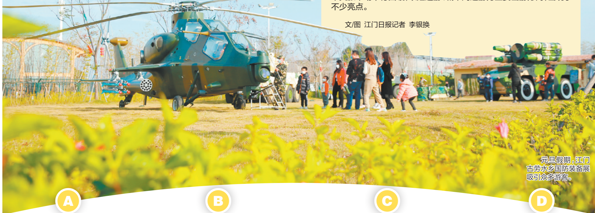
元旦假期,江门古劳水乡国防装备展吸引众多游客。