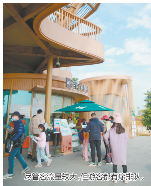
尽管客流量较大,但游客都井然有序。