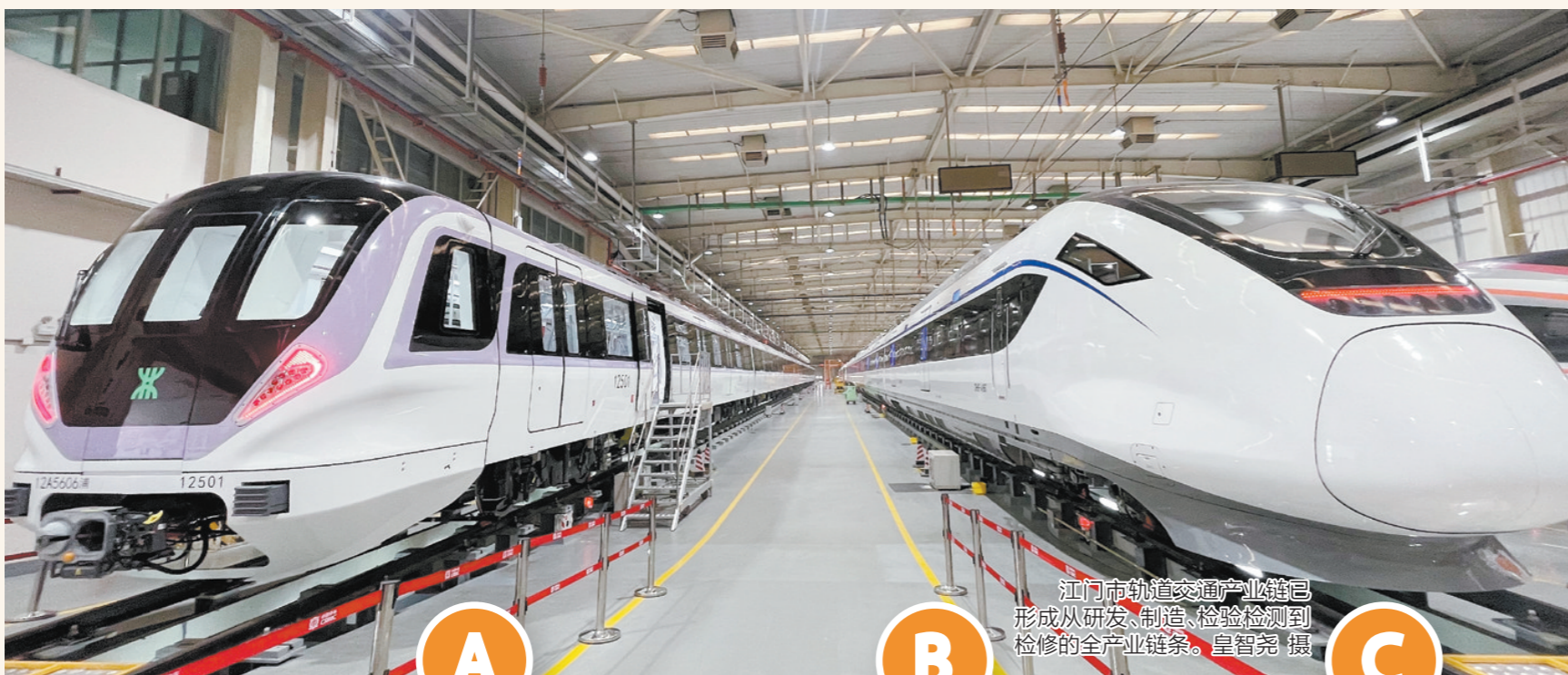
江门市轨道交通产业链已形成从研发、制造、检验检测到检修的全产业链条。