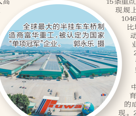
全球最大的半挂车车桥制造商富华重工,被认定为国家级“单项冠军”企业。