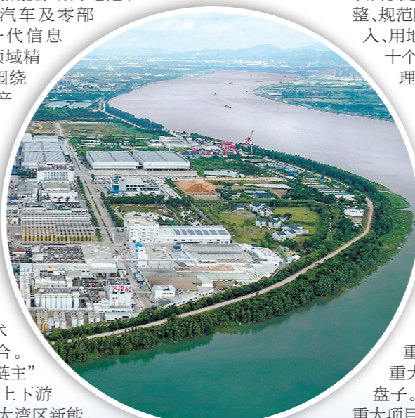
▲新会区围绕大健康产业，积极打造七堡食品健康产业园。