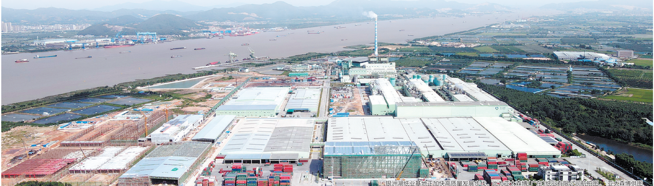
银洲湖纸业基地正加快高质量发展步伐。此为亚太森博(广东)纸业有限公司航拍图。