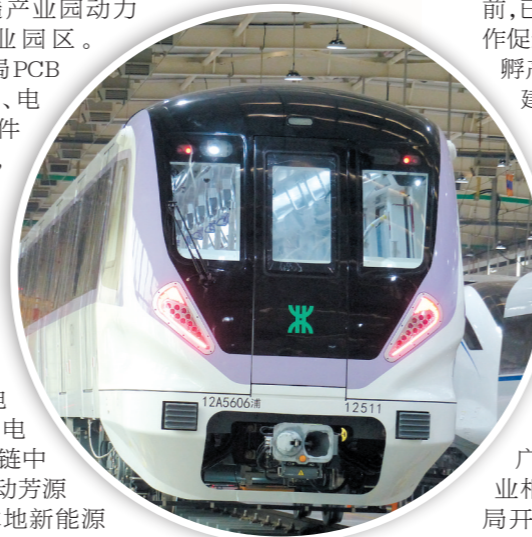
▲新会区正加快推进轨道交通产业园发展。