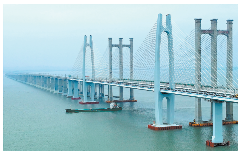
2月4日拍摄的新建福厦铁路泉州湾跨海大桥(无人机照片)。