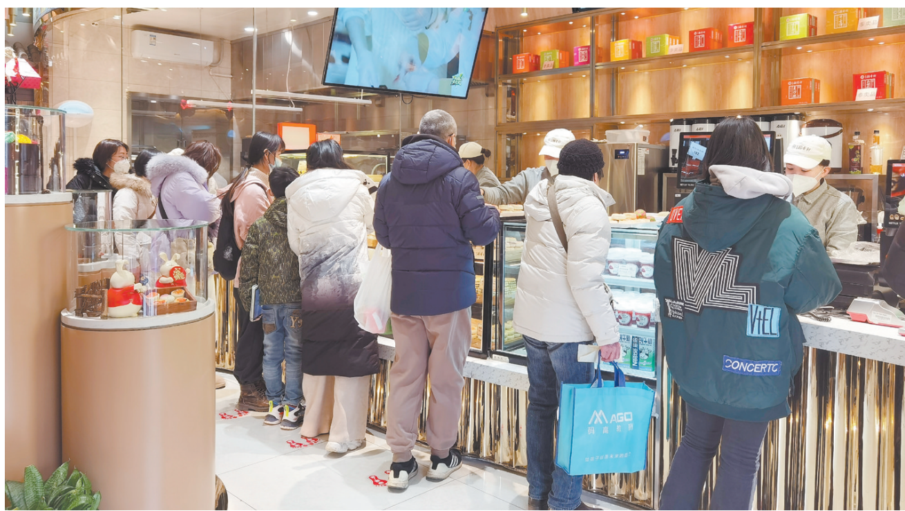
顾客在北京稻香村“零号店”排队购买糕点(2月1日摄)。

党的二十大报告提出，增强消费对经济发展的基础性作用。去年底召开的中央经济工作会议部署，要把恢复和扩大消费摆在优先位置。《扩大内需战略规划纲要（2022—2035年）》提出，“打造中国品牌，培育和发展中华老字号和特色传统文化品牌”。