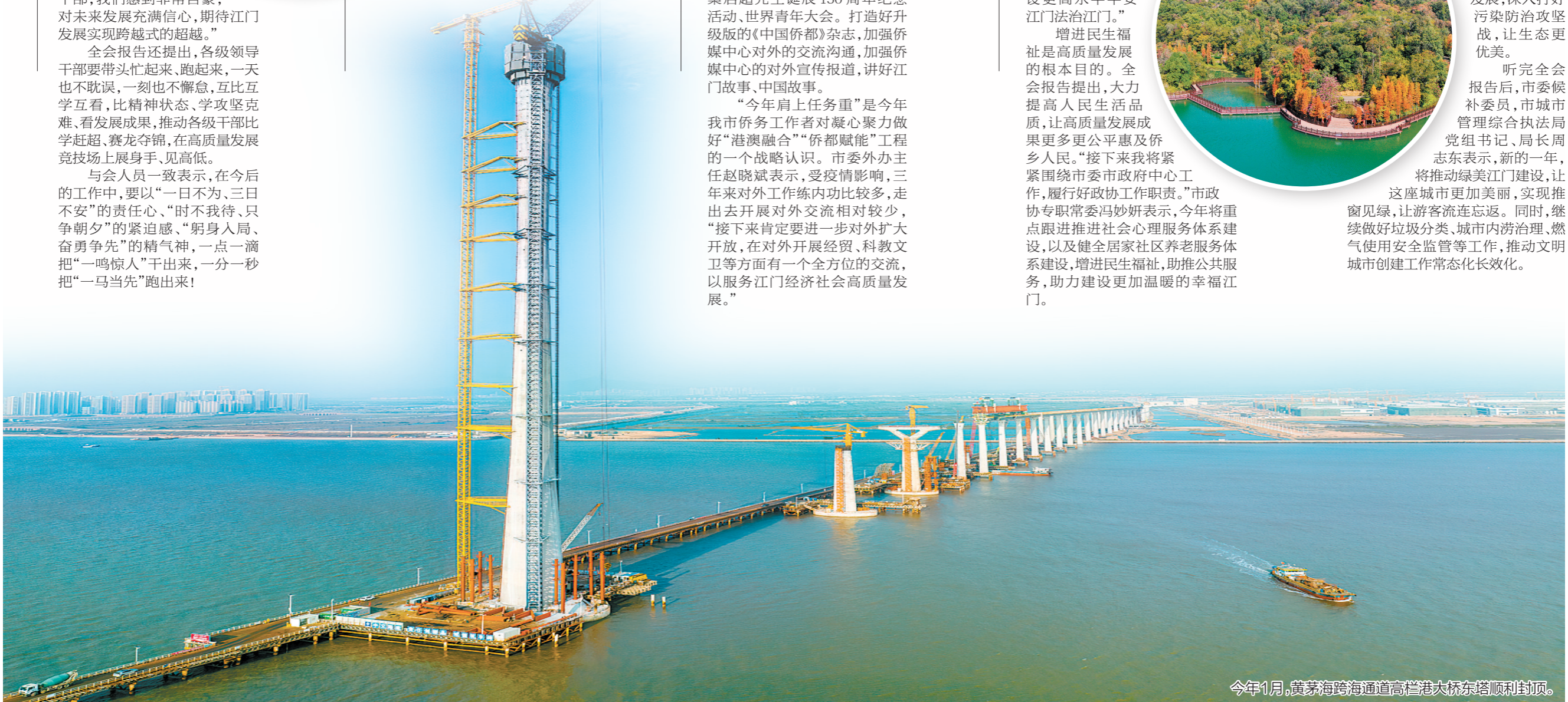
今年1月，黄茅海跨海通道高栏港大桥东塔顺利封顶。