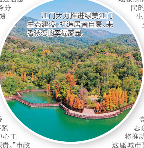
江门大力推进绿美江门生态建设，打造宜居宜业、来者恋恋的幸福家园。