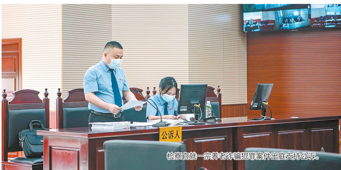
检察官就一宗养老诈骗犯罪案件出庭支持公诉。