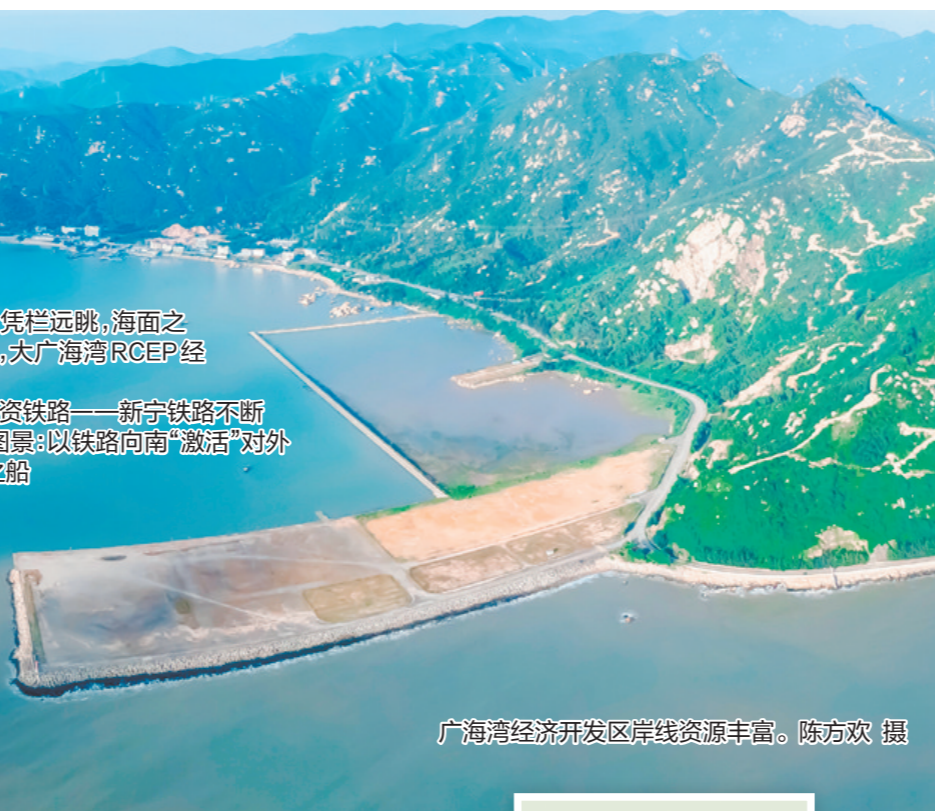
广海湾经济开发区岸线资源丰富。