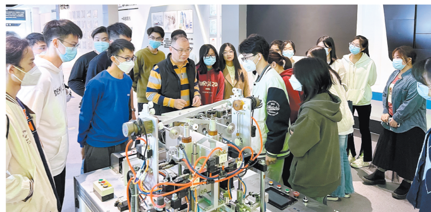
“邑”日青年人才行活动现场。

自2021年起，团市委联合市住建局连续两年开展“青年安居计划”，推出“低租、减费、免押”的优质公租房累计38套，支持高校应届毕业生在江门扎根发展。2023年江门市政府工作报告提出，