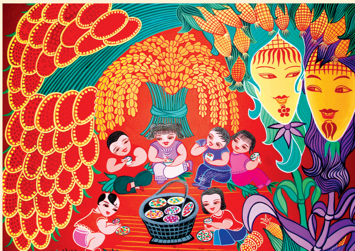
丽达民间文化艺术工作室 赵丽达作