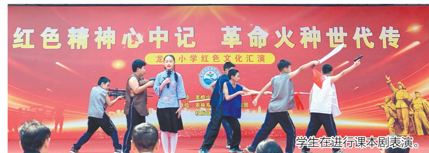
学生在进行课本剧表演。

江门日报讯“为光耀门楣而读书”“为中华之崛起而读书”……学生们深情演绎课本剧《为中华之崛起而读书》,赢得了现场师生雷鸣般的掌声。4月7日,蓬江区杜阮镇龙岭小学举办了“红色精神心中记 革命火种世代传”红色文化汇演活动。