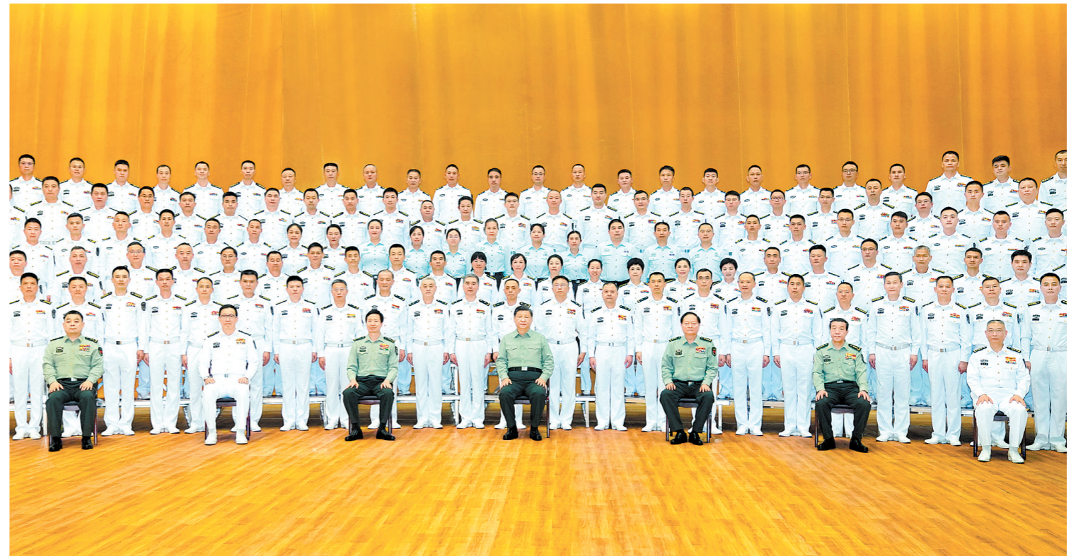
4月11日，中共中央总书记、国家主席、中央军委主席习近平到南部战区海军视察调研。这是习近平在听取南部战区海军有关工作汇报后发表重要讲话。