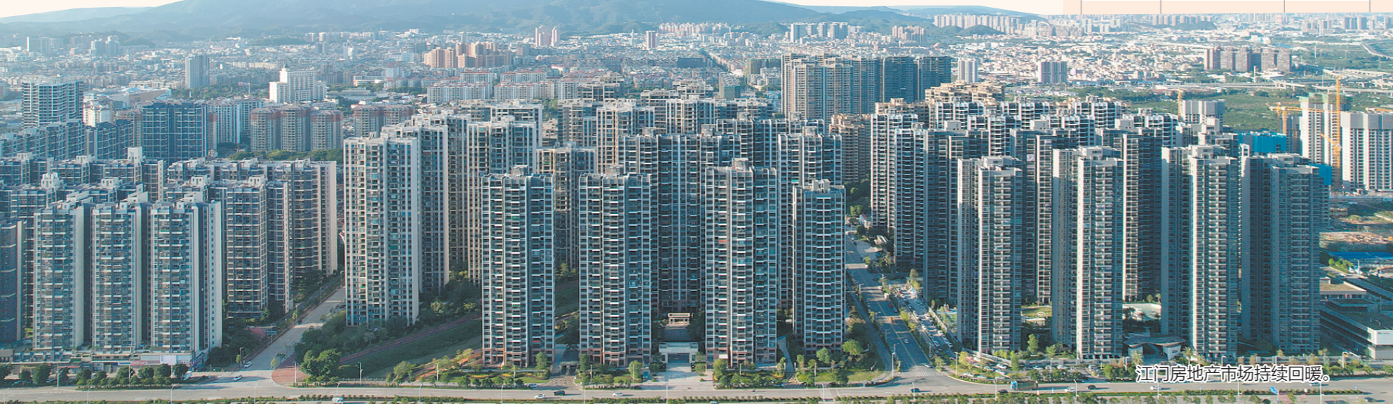
江门房地产市场持续回暖。

答:节假日期间,公积金中心仍会正常扣收贷款本息,请广大借款人按时还款。 (李银换)