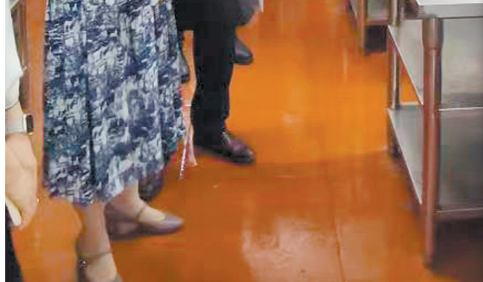
区政协经济和人口资源委员会与提案委员会的委员们在五邑大学创新创业学院调研产业数字化转型升级情况。