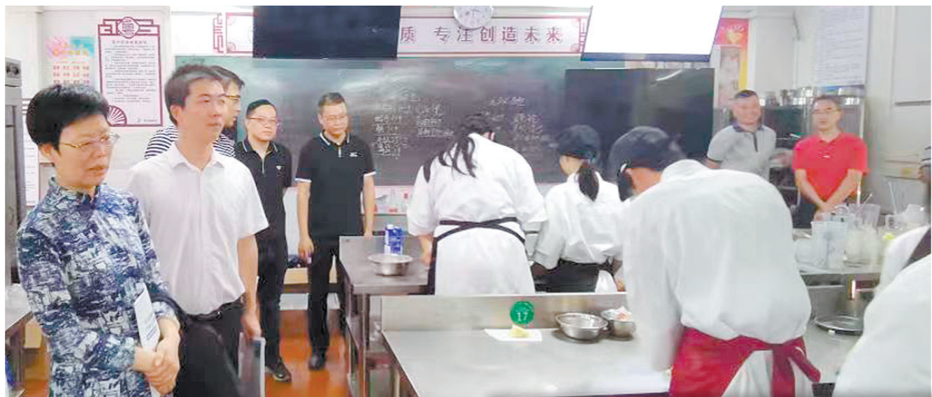
区政协科教文卫体委员会委员到新会技师学院(冈州校区)广东省粤菜师傅培训基地开展专题调研。

据悉,为加强企业供需对接,推进新会区强链补链延链,新会区政协提案委员会与经济和人口资源委员会将根据区政协2023年协商计划,联合区工商联,组织召开“企业家委员约见区政府领导座谈会”,与区直有关部门及相关镇(街)协商交流,进一步推动企业提质增效。