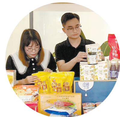
企业做好准备,对即将到来的直播节充满期待。

江门日报(文/图 记者/任晓盈 通讯员/张凯欣)5月20日,2023年第四届江门直播节暨江门优品选品会在新会扬帆电商科技产业园举行,各大商家、网络大咖现场分享经验,进行互动交流,为促进本地好物“走出去”共同发力。