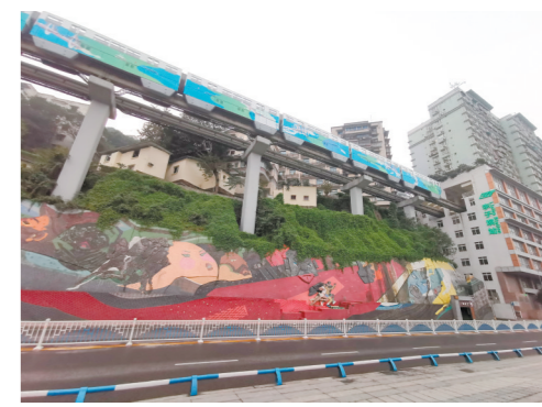
到重庆看“硬核”交通如何跨越穿江。