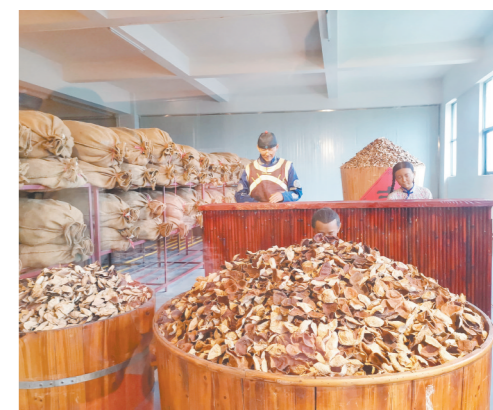
到陈皮古道了解陈皮文化。

江门日报讯(文/图 记者李银换) 6月10日是2023年“文化和自然遗产日”,广东省文化和旅游厅推出“粤见非遗潮玩岭南”10条非遗旅游精品线路,通过串联一批国家级、省级非遗代表性项目,于旅游中进一步提高非遗的可见度、影响力,在促进非遗广泛传播和合理利用的同时,为广东旅游业注入更富吸引力的文化内涵,助力粤港澳大湾区世界级旅游目的地建设。此次推出的10条非遗旅游精品线路,包括广州、佛山、东莞、江门、中山、肇庆、梅州、茂名、湛江、潮州、汕头、清远等12个城市。江门“五邑文脉·非遗探索之旅”线路上榜,包含了4个江门非遗项目。