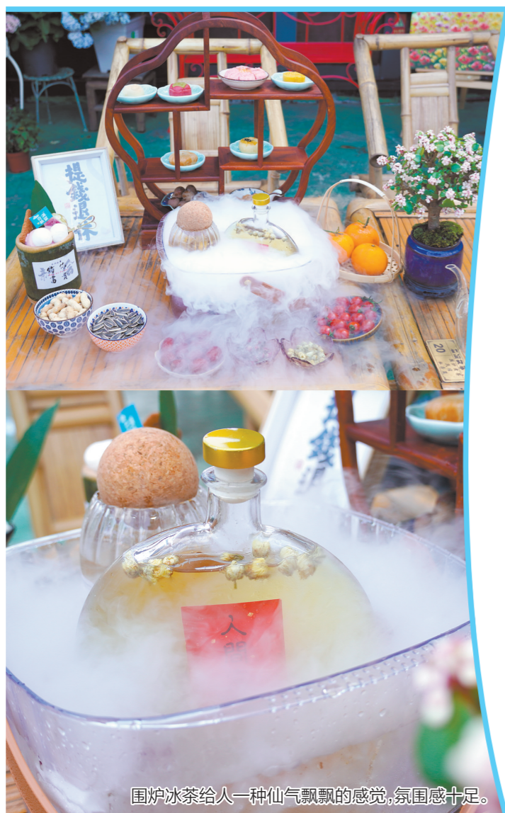
围炉冰茶给人一种仙气飘飘的感觉,氛围感十足。

“来一桌围炉冰茶,看云雾吞吐;配几碟精美点心,品花开花落”。日前,这句颇有诗意的文案迅速出圈,引爆了围炉冰茶这一新鲜话题。