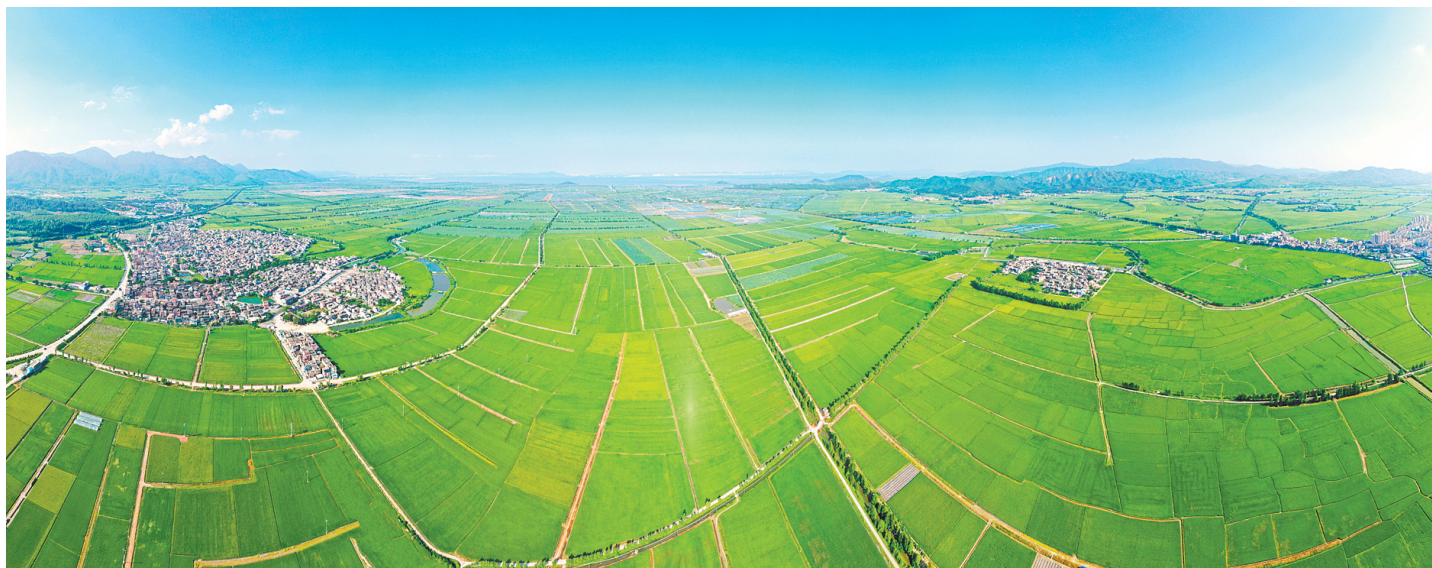
我市将大力实施江门“广东第一田”三年提升工程，着力将江门“广东第一田”建成亩产千斤、两季吨粮的稳产高产“口粮田”。郭永乐 摄