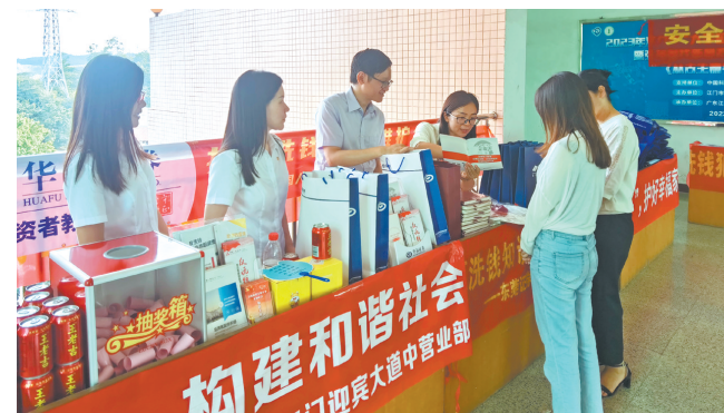
证券机构工作人员走进校园开展防范非法集资宣传月活动。

江门日报讯(文/图 记者/傅雅蓉)反洗钱的主要制度有哪些?常见的洗钱套路有哪些?参与洗钱活动的后果是什么?……近日,为了推动反洗钱校园宣教的普及化、激发学生对于反洗钱知识和技能的学习热情,提高防范金融诈骗的意识,江门市证券业协会及上市公司协会联合市辖区证券机构走进我市各大校园,开展了多场以“守住钱袋子·护好幸福家”为主题的防范非法集资宣传月活动。