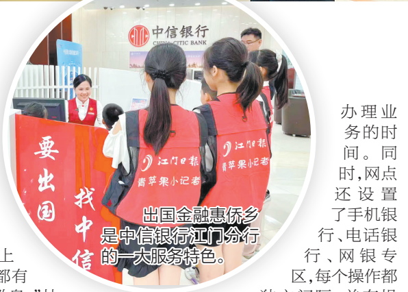
中信银行江门分行是中信银行江门分行的一大服务特色。

近年来，随着互联网金融的快速发展，该行在加快推进网点智能化升级的同时，也十分注重保护客户个人信息保护和隐私。“如今，客户在网点的智能柜上就可以直接办理开户、换卡等数十种业务，大大缩短客户排队等候和