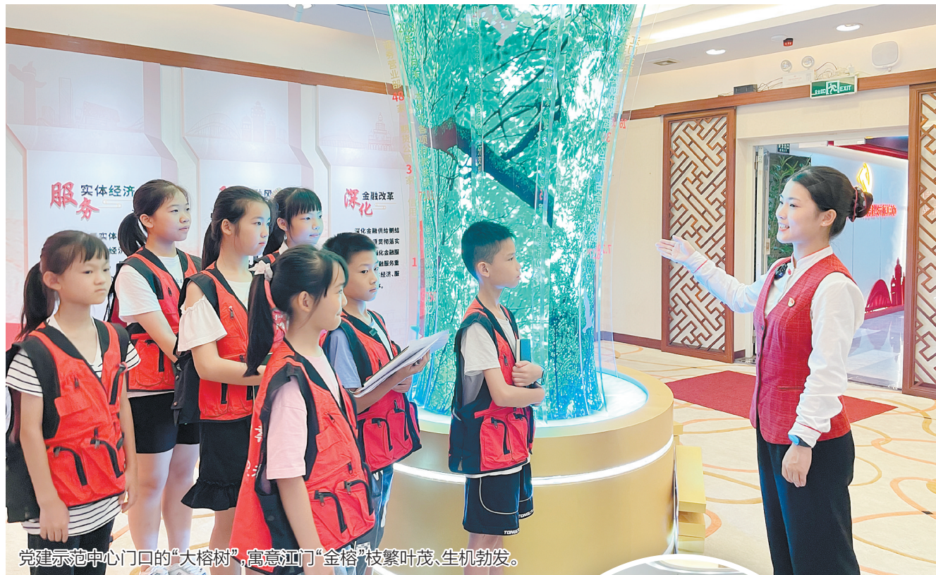
党建示范中心门口的“大榕树”，寓意江门“金榕”枝繁叶茂、生机勃勃。