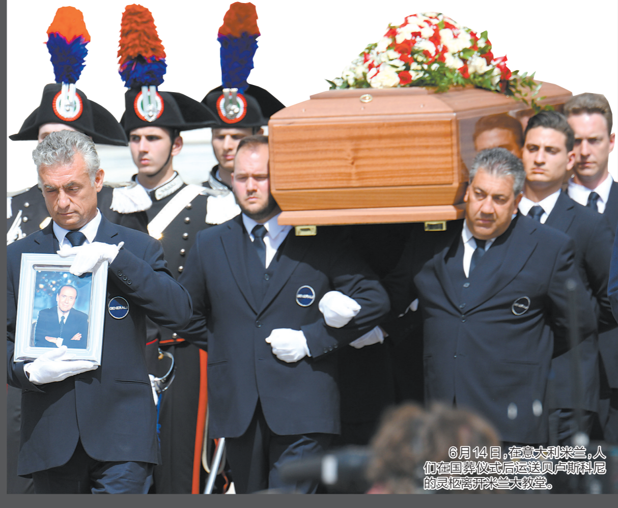
6月14日，在意大利米兰，人们在国葬仪式后运送贝卢斯科尼的灵柩到新米兰大教堂。

2022年乌克兰危机全面升级后，贝卢斯科尼在病榻前最后一次登上全球媒体头条，他回顾了俄罗斯总统普京送他20瓶伏特加作为生日礼物的往事，并批评乌克兰总统泽连斯基“挑起战争”。这些言论遭到梅洛尼政府斥责。贝卢斯科尼去世后，普京深切哀悼这位“真正的朋友”，回忆道“在我们的每次会面中，我都把他难以置信的活力、乐观和幽默感所感染”。