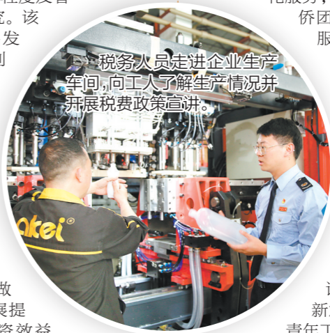
税务人员走进企业生产车间，向工人了解生产情况并开展税费政策宣讲。