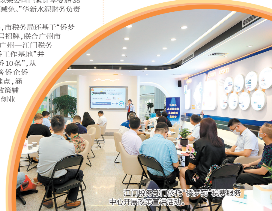
江门税务部门依托“侨梦苑”税费服务中心开展政策宣讲活动。