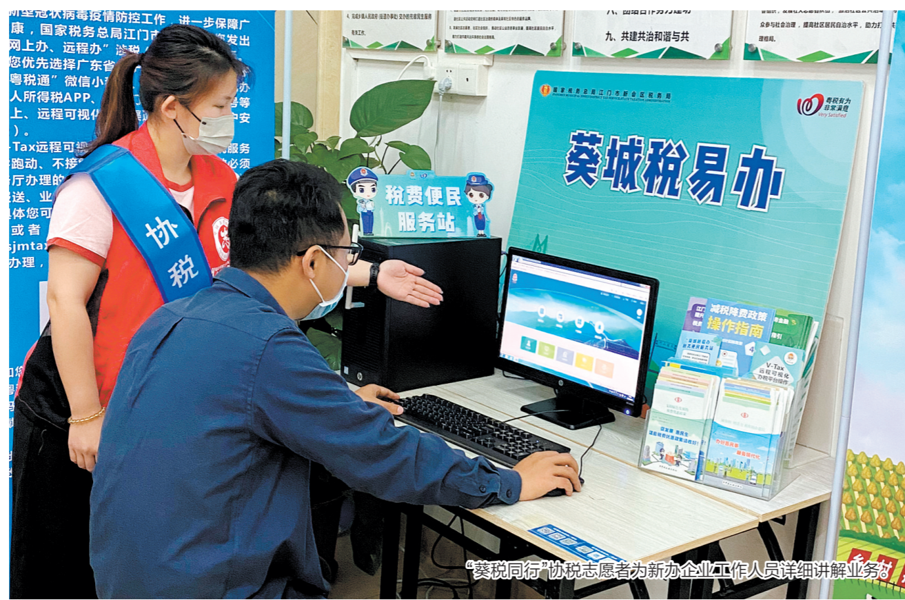
“葵税同行”协税志愿者为新办企业工作人员详细讲解业务。

服务,“葵税同行”协税志愿者还将化身“税费服务体验师”,从纳税人缴费人角度出发,在纳税体验活动中发现问题并提出对策,推动纳税服务水平和纳税人