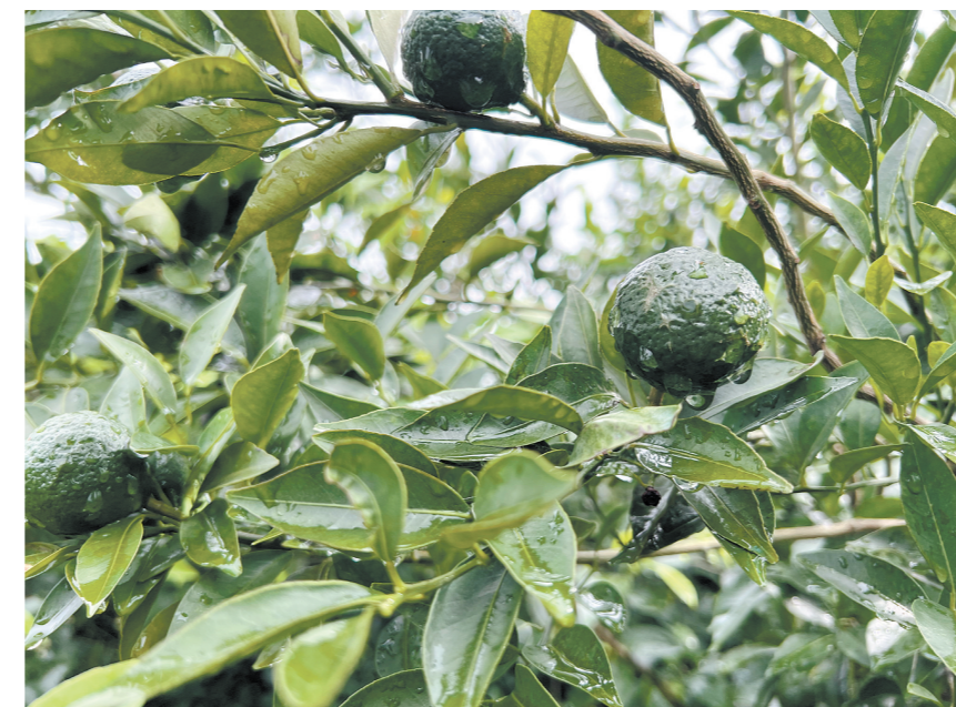
风雨过后,要对柑树及时做好管护,保障新会柑丰产丰收。

新会区农业农村局相关负责人表示,风雨过后,还要及时做好病虫害防治,进入弱树保健模式,每七天进行一次全价营养型叶面肥补给,总次数不少于3次,待土壤干爽后,再采用全价水溶肥根际施薄施与叶面喷雾薄交替配合,补给有效氮、磷、钾和钙、镁、锌等营养元素。针对已形成根腐、裙腐的树,树势已衰退,但树冠还好,待土壤干爽后,要进行根系和树冠更新。同时,坚决清理严重黄化衰退的树,及时补种大苗,确保健康。