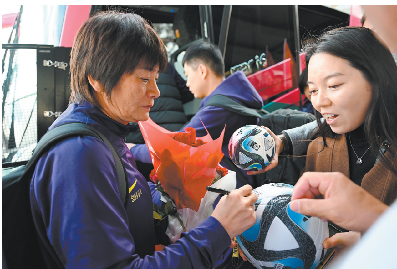
7月20日，中国女足主教练水庆霞（左）在珀斯机场为球迷签名。当日，中国女足抵达澳大利亚珀斯，她们即将于7月22日在此与丹麦队进行本届世界杯的首场比赛。

基于此，首场比赛在做好防守的基础上，争取拼出“开门红”，为随后的比赛打下基础，无疑是中国队的目标。赛后王珊珊的话说，小组赛肯定会遇到困难，但大家“肯定会踢出最好的状态”。杨莉娜等老将则表示，她们可能是最后一次参加世界杯，必将“竭尽所有力量”，做到最好。带着这样的信心和信念，即将第八次登上世界杯舞台的中国女足，虽挑战重重，仍值得期待。