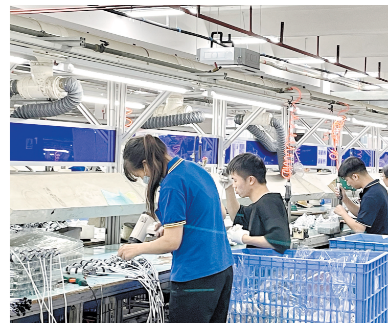
我市建立“一户两主办行”对接模式为制造业提供金融支撑。

为全面落实广东省委十三届三次全会、全省高质量发展大会部署要求,深入推进江门“科技引领”“工业振兴”“园区再造”工程,近日,人民银行江门市中心支行联合市金融局在全省率先制定制造业企业主办银行对接行动方案(简称“行动方案”),建立“一户两主办行”对接模式,推动实现“提效能”“促动能”“聚势能”,为制造业高端化、智能化、绿色化发展提供金融支撑,力争2023年全市新增制造业贷款200亿元。