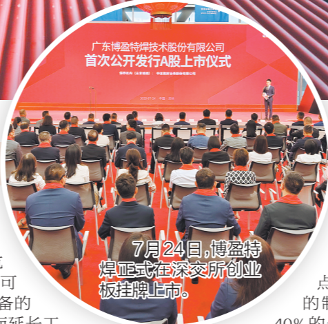
7月24日,博盈特焊正式在深交所创业板挂牌上市。

以垃圾焚烧锅炉为例,以前的堆焊技术是把垃圾焚烧余热回收锅炉的炉面都焊上防腐、耐高温金属材料,但实际上锅炉在使用时只有一面受热,这样做成