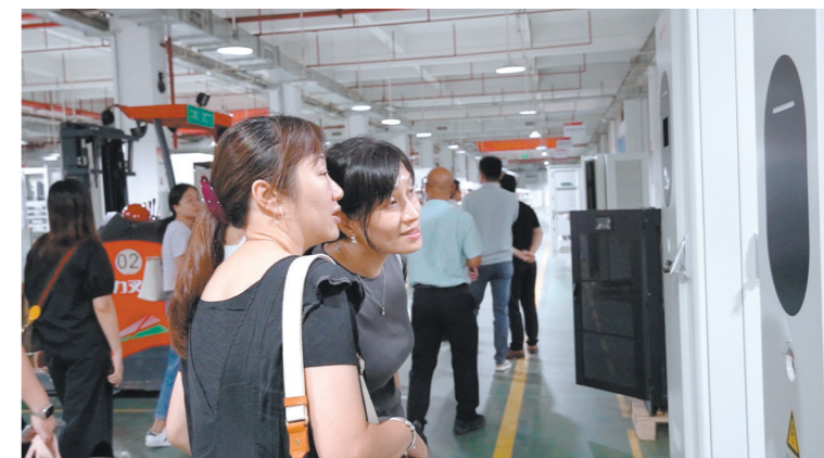
交流团在易事特参观学习。

江门日报讯(文/图 记者/陈倩婷 吕胜根)7月21日,江门日报社组织市银行、保险以及金融行业协会、商业协会代表等财经界人士赴东莞松山湖国家高新区参观学习,近距离感受这座科创新城“科技共山水一色”的独特魅力,领略产城融合的发展蝶变。