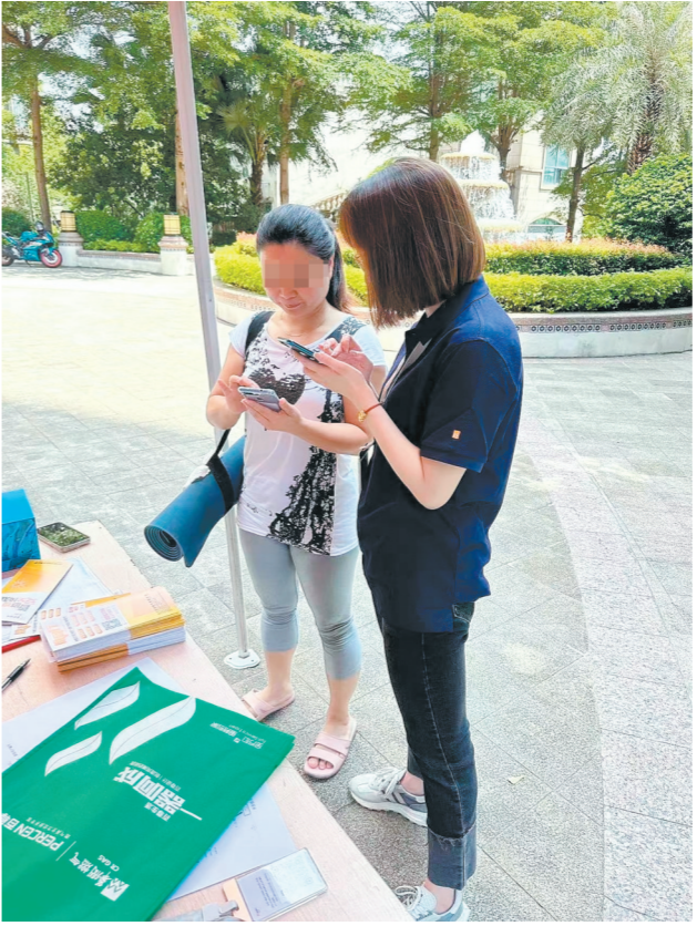
江门华润燃气工作人员到社区推广“燃气管家”。

那么，广大用户可以如何添加“燃气管家”，获取专属服务？只要扫描下方二维码，即可添加江门华润燃气管家企业微信，然后向燃气管家发送用户信息（详细地址、用户姓名、联系方式），即可马上享受“燃气管家”一站式服务，快来认领你的“燃气管家”吧！