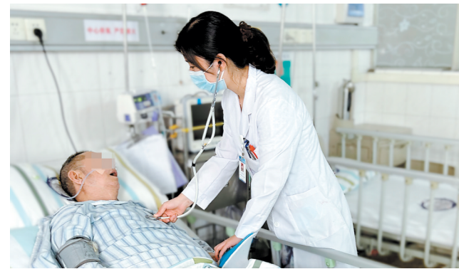
医生为癫痫患者检查身体。