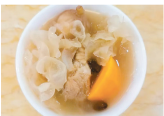
白露节气多喝汤水防秋燥。