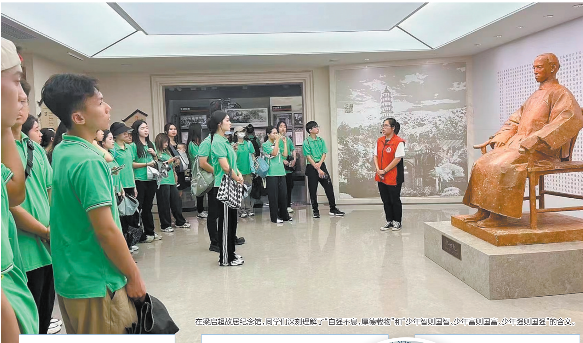
在梁启超故居纪念馆,同学们深刻理解了“自强不息,厚德载物”和“少年智则国智、少年富则国富、少年强则国强”的含义。