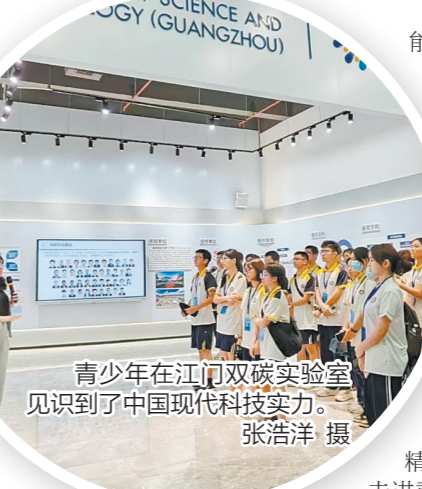
青少年在江门双碳实验室见识到了中国现代科技实力。

此外,广大港澳台侨青少年还通过走访良溪古村、陈白沙纪念馆、崖门古战场等名胜古迹,了解侨乡深厚的历史底蕴,通过参观自力村、海口埠等建筑风情,见识到了“开平碉楼与村落”“侨批档案”等世遗名片的风采,通过学习汉语、书法,制作茅龙笔、葵扇、东艺宫灯等,感受到中华传统文化博大精深之美,通过聆听中国航空之父冯如、中国侨办营铁路之父陈宜禧、爱国侨领司徒美堂、革命烈士周文雍等侨乡名人的故事,体悟他们身上浓浓的爱国情怀和自立自强等精神。