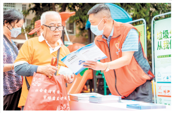
↑市场监管部门多次进社区、进企业开展相关宣传活动，引导市民群众关注质量工作。