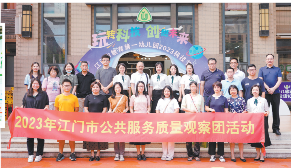
2023年江门市公共服务质量观察团活动

←今年8月，市市场监管局联合市教育局、市民政局、市政数局共同开展公共服务质量观察团活动，邀请我市人大代表、政协委员、市民群众、企业代表、媒体记者等20多人组成观察团，走进蓬江区幸福四季家园养老中心等公共服务场所，了解我市公共服务质量状况。