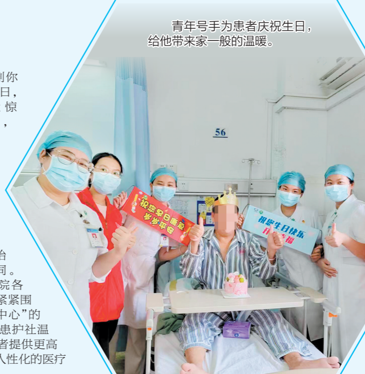
青年号手为患者庆祝生日,给他带来家一般的温暖。