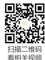
扫描二维码看相关视频