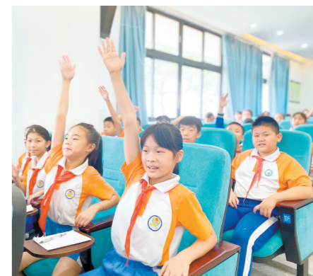
同学们踊跃举手,积极抢答。

江门日报讯(文/图 李影 李春梅)为加强知识产权文化建设,进一步提升我市知识产权工作水平,提高青少年尊重知识、崇尚创新、保护知识产权意识,昨日,在开平市三埠街道祥龙学校,由江门市市场监督管理局(知识产权局)携手江门日报青苹果小记者中心共同举办了一场知识产权讲座,该校共142名小学生参与。