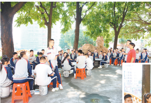
大树底下,师生们玩起了“飞花令”。