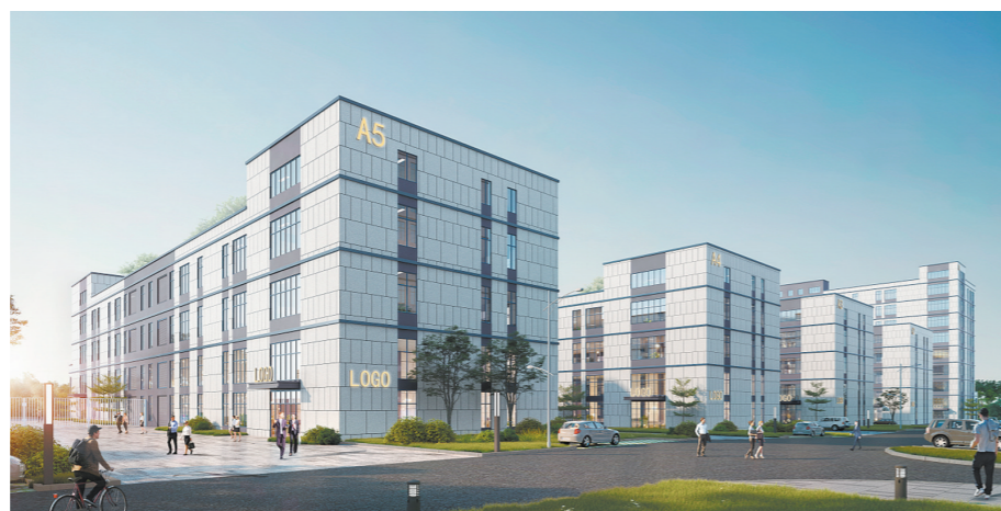
澳湾奎地电子科技产业园建成效果图。