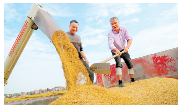
金秋时节，各地农民抢抓农时开展秋收、秋种工作。10月21日，在湖南省永州市新田县三井镇山下村，村民收获水稻。