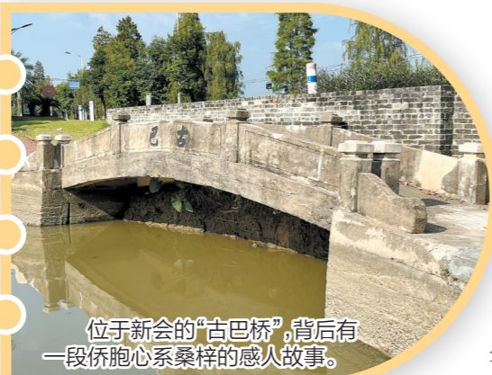
位于新会的“古巴桥”，背后有一段侨胞心系桑梓的感人故事。

从新会区沙堆镇那伏村走出，沿着村口公路刚走两步，一座造型朴素的单孔拱桥就出现在眼前。只见拱桥桥梁基本保存完好，桥护栏上刻有“古巴”字样的水泥凹字仍清晰可见。