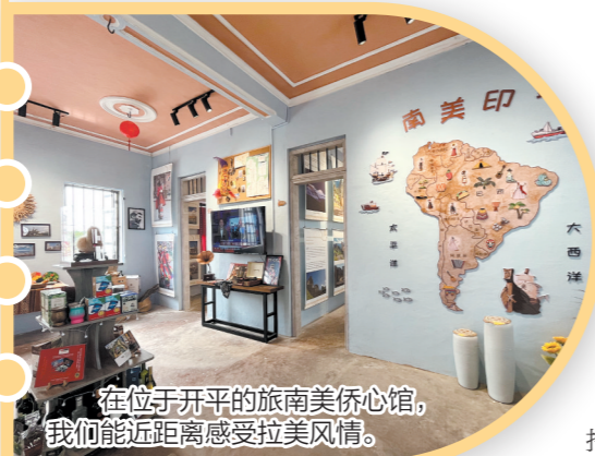
在位于开平的旅南美侨心馆，我们能近距离感受拉美风情。

百年旧宅被赋予全新使命，成为瞭望世界、回顾历史的窗口。在开平市蚬冈镇，有一座曾经的侨房蝶变为旅南美侨心馆，讲述着这方小镇与万里之外南美地区之间的侨胞故事。