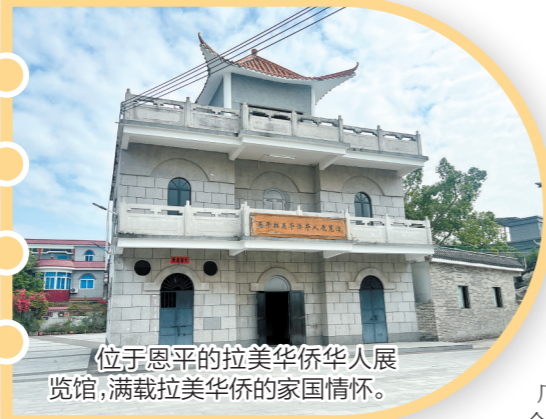
位于恩平的拉美华侨华人展览馆，满载拉美侨胞的家国情怀。

江门市下辖的恩平市，有海外侨胞48万余人，分布于全球37个国家和地区，其中拉丁美洲有27万余人，集中在委内瑞拉、多米尼加等地。