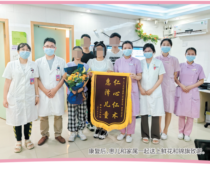
康复后，患儿和家属一起送上鲜花和锦旗致谢。