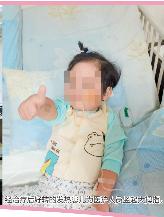
经治疗后好转的发热患儿为医护人员竖起大拇指。