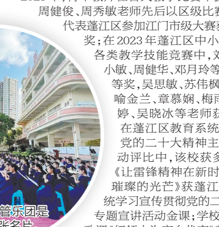
2019年，培英小学升旗仪式上，培英小学《开学第一课》是广东省唯一入选的学校。