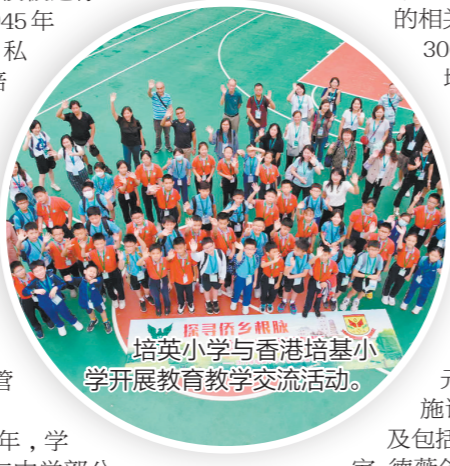
原培英多组培英小学开展教育教学交流活动。

继续开来，“白绿”增辉。百年培英，有读书声、呐喊声、欢笑声、管乐声。在百年的历史长河中，培英小学将“白绿精神”注入校魂，如松柏长青；把“全人教育”写上蓝天，与雄鹰结伴。朴实、勤奋、团结的培英人充满希望，要将这未竟的教育事业继续书写下去。