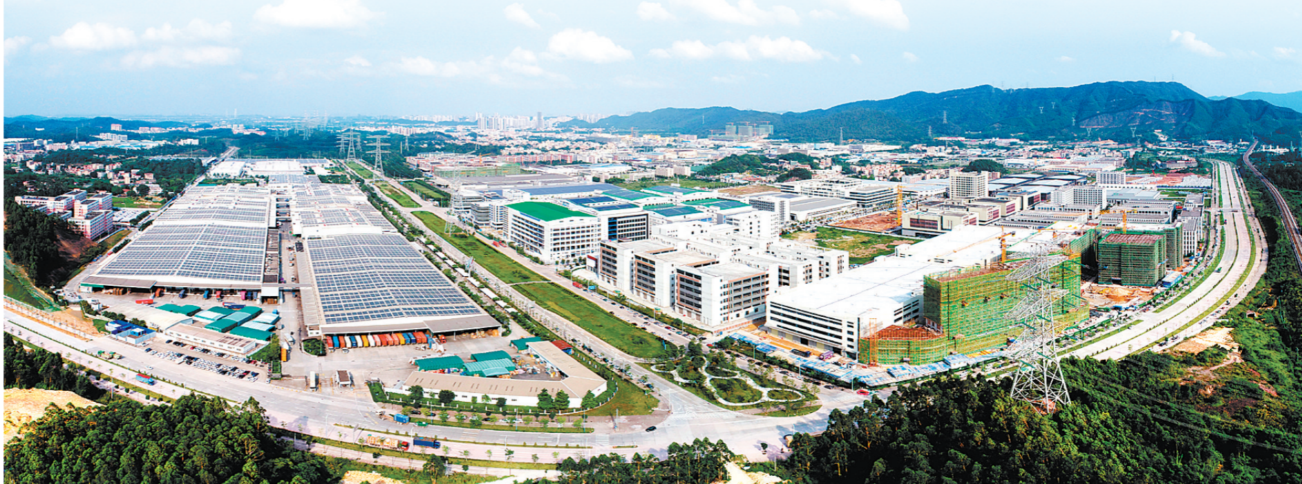
今年以来,蓬江区把招商引资作为“牛鼻子”战略工程,举全区之力大招商、招大商。截至12月中旬,该区已引进63个项目,完成进度140%,计划总投资额248.81亿元。图片为蓬江产业园。

下一步,蓬江区将继续以跑在前的先锋姿态,勇往直前的奋斗状态,不胜不休的决战状态,巩固深圳“百日攻坚”招商行动成果,持续瞄准重点领域招新引优,推进重点产业招群引链,加快形成新的经济增长点。