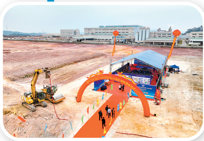
12月18日上午,君乐宝华南基地项目正式开工建设。